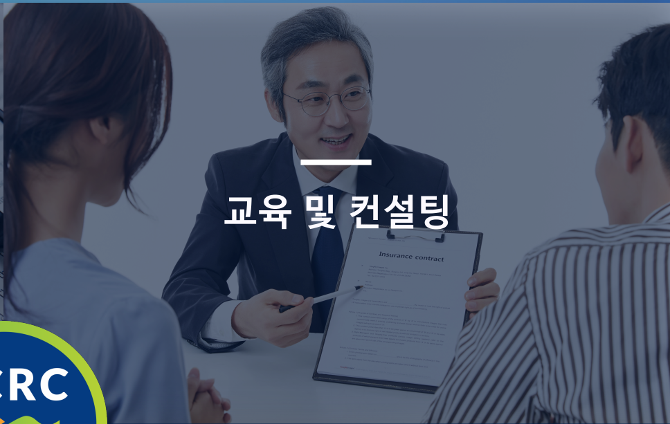
교육 및 컨설팅