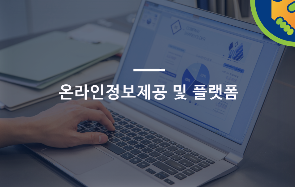
온라인정보제공 및 플랫폼